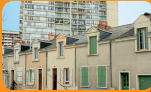
Quartiers à logements mixtes