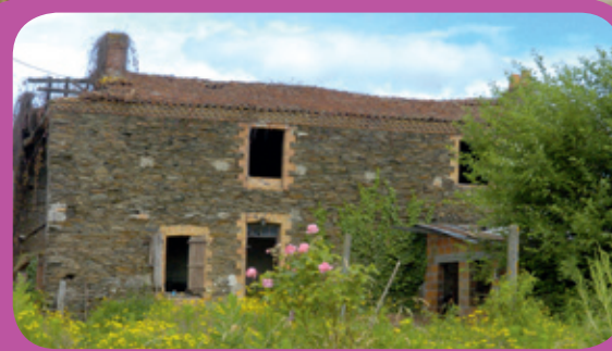
Projet de réhabilitation de logements

2008-07 medipolite. Angers - 02 41 30 94 26 Conseil général de Maine-et-Loire Ce document contient 50% de papier recyclé