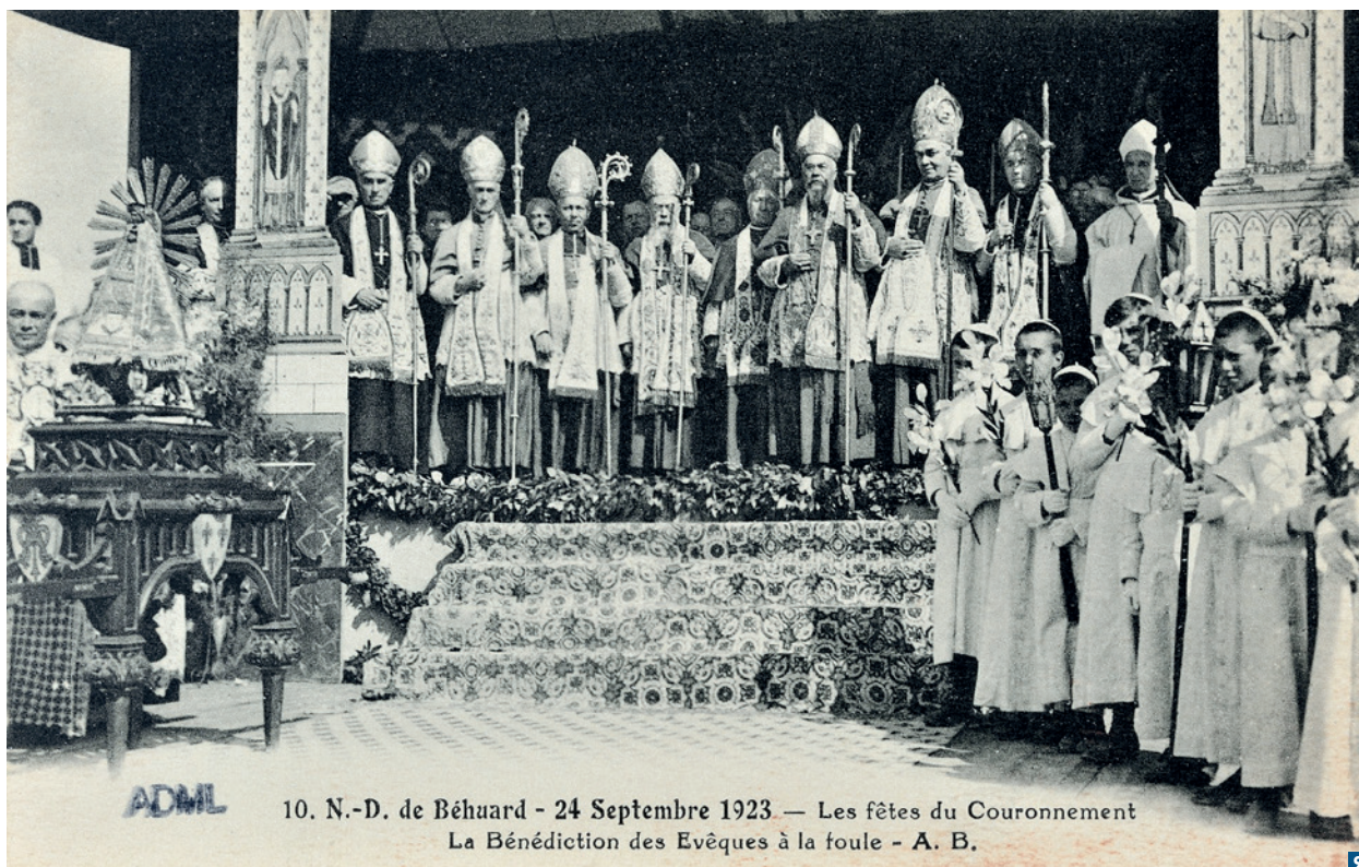
10. N.-D. de Béhuard - 24 Septembre 1923. — Les fêtes du Couronnement La Bénédiction des Evêques à la foule - A. B.