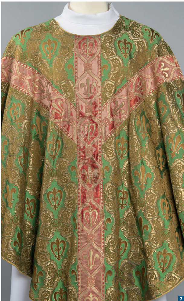
Chape verte par Victor Perret