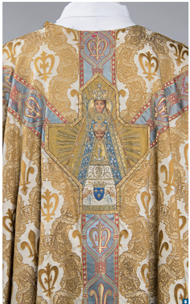
Détail de la chape blanche brodée de la Vierge de Béhuard par Victor Perret.