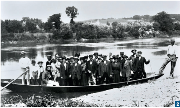
La traversée de la Guillemette. Au fond, la Roche-aux-moines. (ADML 6 Fi 1579).

mention dans certaines relations comme « deux bateaux à vapeur frétés et pavoisés pour la circonstance » 1 . Chaque année à partir de 1873, les fidèles venaient de tout l'Anjou en famille ou dans des groupements paroissiaux, scolaires, universitaires.