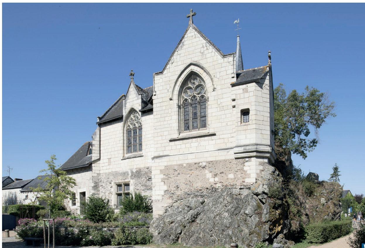
Vue générale de la chapelle de Béhuard.

M gr Freppel, évêque d'Angers, remit en valeur ce sanctuaire et les pèlerinages du 8 septembre des années 1873, 1910 et 1923, marquèrent fortement la petite île. Tirant la leçon des pèlerinages qui se développaient alors à Lourdes et à Pontmain, le prélat exhorta les catholiques angevins à revenir à Béhuard. Ils utilisèrent surtout le chemin de fer et parfois la voie d'eau, comme l'attestent les photographies de l'époque et la