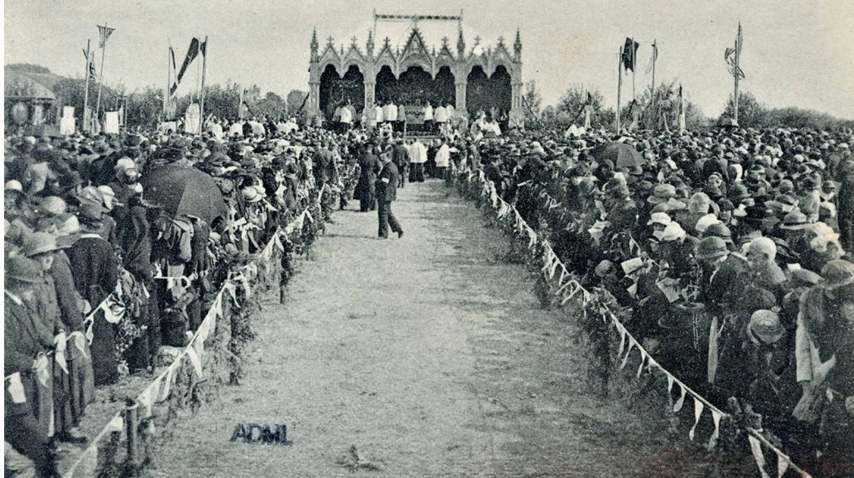
Fête du Couronnement le 24 septembre 1923, carte postale (ADML, 6 Fi 1558).

couronne est agrémenté d'une fleur de lys pavée de cinq brillants. Un sceptre complète l'ensemble. Il est formé d'une fleur de lys ornée de quatre brillants de chaque côté avec en supplément, une pierre rouge sur la face. Deux chaînes s'enroulent autour de la hampe. Le nom de l'orfèvre est gravé à l'intérieur de ces objets « Mellerio dit Meller, rue de la Paix, Paris. 24 septembre 1923 » mais aucune archive n'a encore livré le secret de la commande. Les orfèvres parisiens Mellerio dit Meller, fournisseurs des régalia des maisons royales européennes au XIX e siècle, avaient aussi réalisé plusieurs couronnes de statues vénérées dans les sanctuaires français (Dunkerque, Mont Saint-Michel par exemple).