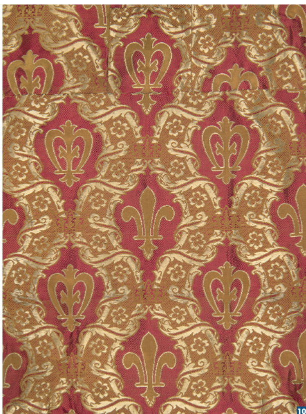
Voile de pupitre rouge par Victor Perret.