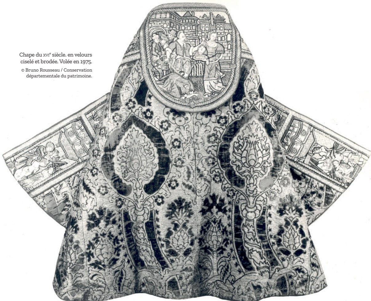
Chape du xvi e siècle. en velours ciselé et brodée. Volée en 1975.