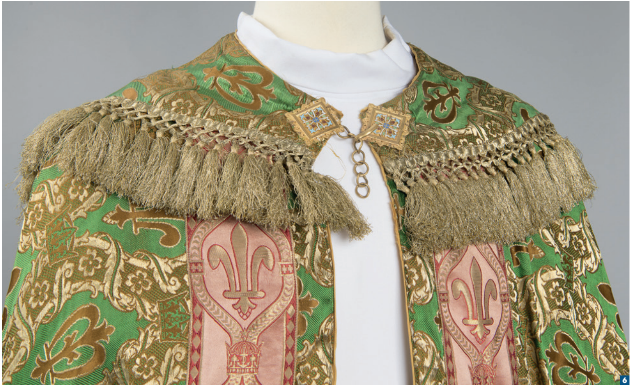
Détail d'une chape verte par Victor Perret.