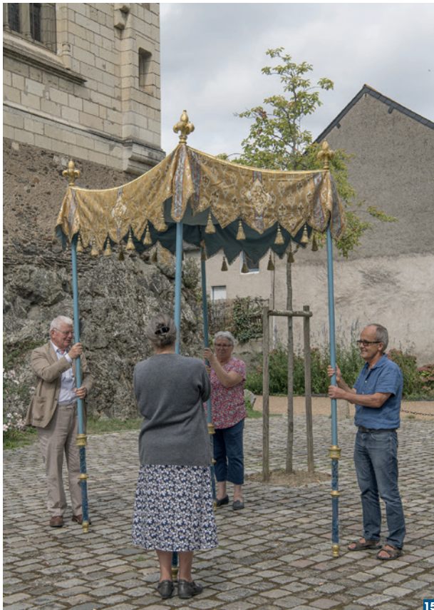
Le dais de procession par Victor Perret.

posés sur la pointe disposés en diagonales. Sont ainsi superposées des lignes de lions dressés affrontés, des châteaux et des fleurs de lys alternés, des aigles éployées. Les bandes d'orfrois imitent les tissus aux cartons si courants à l'époque médiévale.