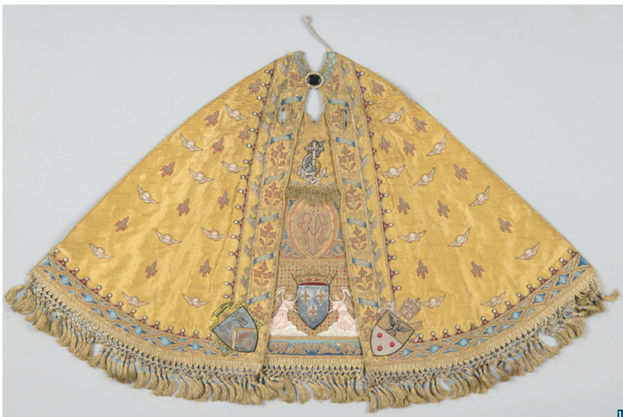
Manteau du Couronnement de la statue de la Vierge. Drap d'or brodé.

L'examen des vêtements présents dans la sacristie, permet d'identifier la commande de deux ensembles. D'une part, ceux issus de la fabrique de Perret, ornés de broderies fines à l'effigie de la Vierge sur les chasubles et de broderies plus ordinaires sur les chapes, d'autre part ceux à fond de drap d'or sans qu'à ce jour, on puisse déterminer la part prise par les clarisses de Mazamet. La statue de la Vierge est figurée avec le manteau du couronnement. Le dais de procession – simplement monogrammé NDB pour Notre-Dame