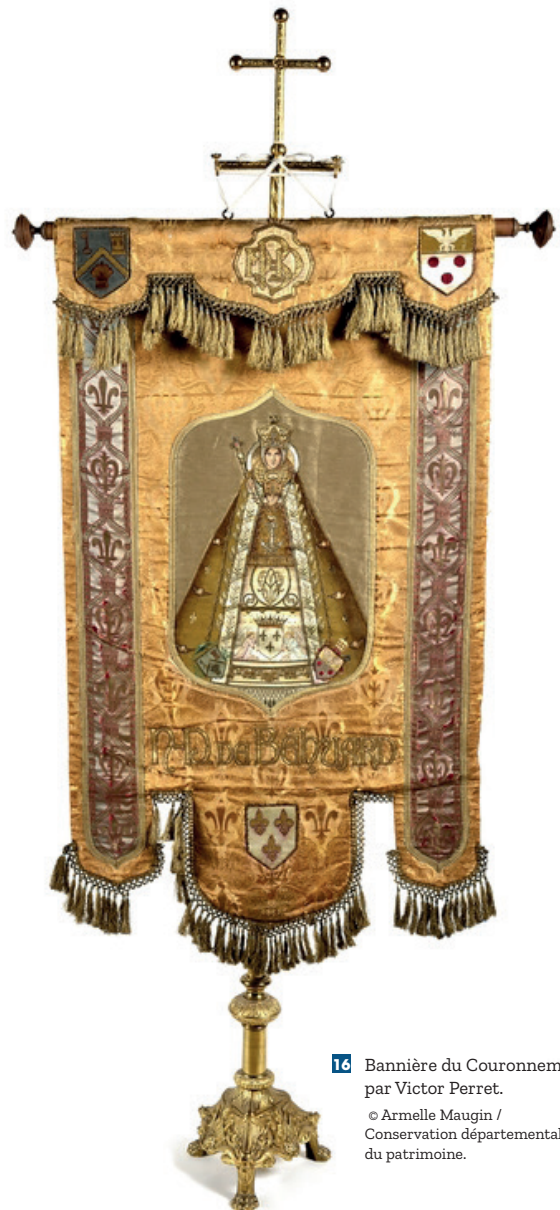
16 Bannière du Couronnement par Victor Perret. © Armelle Maugin / Conservation départementale du patrimoine.

19 - Josiane Pagnon, File le Temps, reste le tissu, ornements liturgiques de la Manche, ed. Conseil général de la Manche, Coutance, 2007, p. 41 à 47.