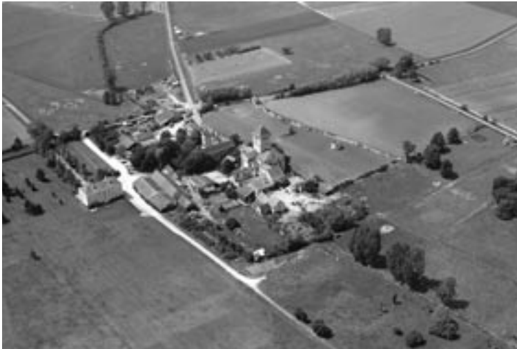
Vue aérienne de l'abbaye.

Les propriétés privées alentours réutilisent actuellement une partie des bâtiments conventuels et des communs. On recense ainsi l'aile occidentale des bâtiments claustraux, une grange monastique du XIII e siècle, l'hôtellerie remaniée, avec une façade néogothique, le logis abbatial du XIV e siècle à l'est. Subsistent également un mur de la salle capitulaire dans le prolongement du transept sud, ainsi qu'un pigeonnier au nord de l'église.