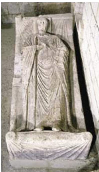
Gisant d'abbé reposant sur un lit de parade.

l'abbatiale. L'une d'elle, du XV e siècle, représente deux religieux dont un abbé. Toutes ces inhumations ont été pratiquées à l'intérieur du chœur.