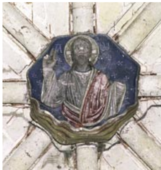
Clef de voûte centrale du chœur.

Le décor sculpté du bras nord du transept et de la chapelle orientée est dédié au thème du Jugement dernier (Christ Juge, élus et damnés...) mais comprend aussi une scène de la vie de saint Martin. Le riche programme iconographique sculpté du chœur a conservé sa polychromie médiévale ; il se développe sur les nombreuses clefs et sur les chapiteaux, autour de la clef de voûte centrale représentant le Christ