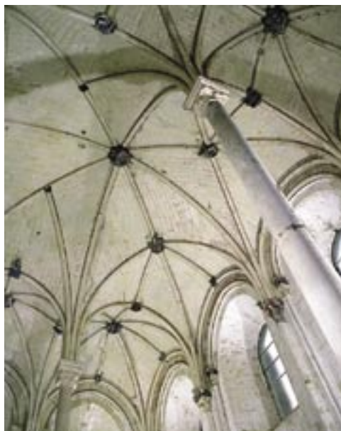
Voûte du chœur reposant sur deux fines colonnes.

De la première église, édifiée dans la première moitié du XII e siècle pour la communauté primitive, ne subsiste plus que le mur nord de la nef, construit en moellons et percé de petites fenêtres. Ce premier bâtiment, modeste, était à nef unique charpentée ; on ignore la disposition du chœur. Dans la seconde moitié du XII e siècle la reconstruction du monastère est entreprise en deux campagnes principales. Les travaux commencent, probablement vers 1160, par le bras sud du transept, voûté d'ogives ; simultanément, on édifie la salle capitulaire. Les épaisses nervures, à bandeau encadré de deux tores, reposent sur des chapiteaux à décor de deux rangs de feuilles lisses. Le bras nord du transept, la croisée et le chœur appartiennent à une seconde campagne attribuée au début du XIII e siècle. La tour-clocher, dotée sur chaque face de quatre arcades en arc brisé, est également édifiée dans la première moitié du XIII e siècle.