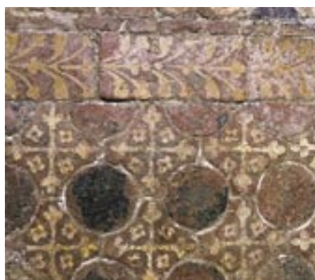
Détail du pavement décoré au XIII e siècle.

Les fouilles réalisées dans les églises angevines ont fréquemment mis au jour des carreaux décorés ; ceux-ci n'ont toutefois pas été découverts en place. Le chœur de l'abbatiale d'Asnières a conservé en revanche une partie de l'organisation du pavement gothique, constitué de longues bandes ornées de motifs variés (dragons, rosaces, rinceaux, armoiries...), s'organisant de part et d'autre d'une grande rosace centrale, malheureusement dégradée. Au sud-est du chœur, la petite chapelle de l'abbé, à deux travées voûtées d'ogives, est plus tardive (XIV e siècle).